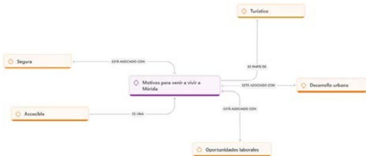
Figura 1. Motivos principales de los nuevos habitantes para venir a Mérida, Yucatán.

La accesibilidad junto a los últimos dos aspectos conforma la manera en cómo la gente de nuestro país percibe al estado de Yucatán, siendo estos las oportunidades laborales que atrae a más fuerza laboral a nuestra ciudad y esto asociado al desarrollo urbano tan acelerado que tiene nuestra Mérida en los últimos años.